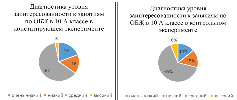
Рис. 1. Сравнительные показатели уровня заинтересованности к занятиям по ОБЖ в 10А классе в констатирующем и контрольном эксперименте

Результатами педагогического исследования является повышение уровня заинтересованности у обучающихся уроками ОБЖ, которые представлены на Рис. 1., Рис. 2.