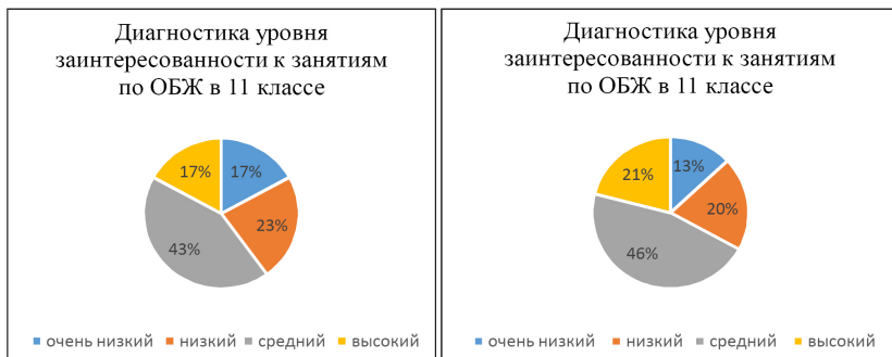
Рис. 2. Сравнительные показатели уровня заинтересованности к занятиям по ОБЖ в 11 классе в констатирующем и контрольном эксперименте

В результате сравнения результатов анкетирования контрольного и констатирующего эксперимента можно сделать вывод, что опрошенных с очень низким уровнем заинтересованности сократилось на 5%, с низким уровнем – на 1%, средний уровень возрос на 3%, а также высокий уровень вырос – на 3%.